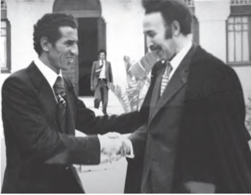
لقاء بين عبد السلام جلود وهواري بومدين، الجزائر.